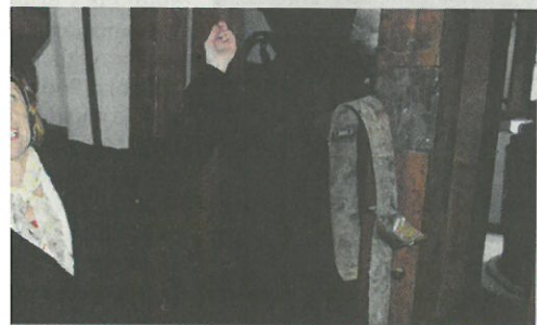
rovayová vo vnútri vynoveného mlynu.